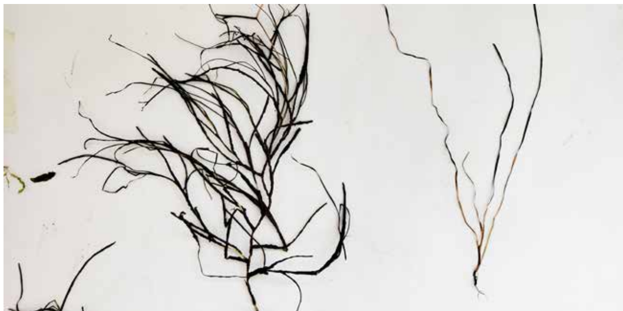
Рисунок 2. Внешний вид морских трав S. pectinata (слева) и N. noltei (справа) Каспия

Figure 2. Appearance of sea grasses S. pectinata (left) and N. noltei (right) The Caspian Sea