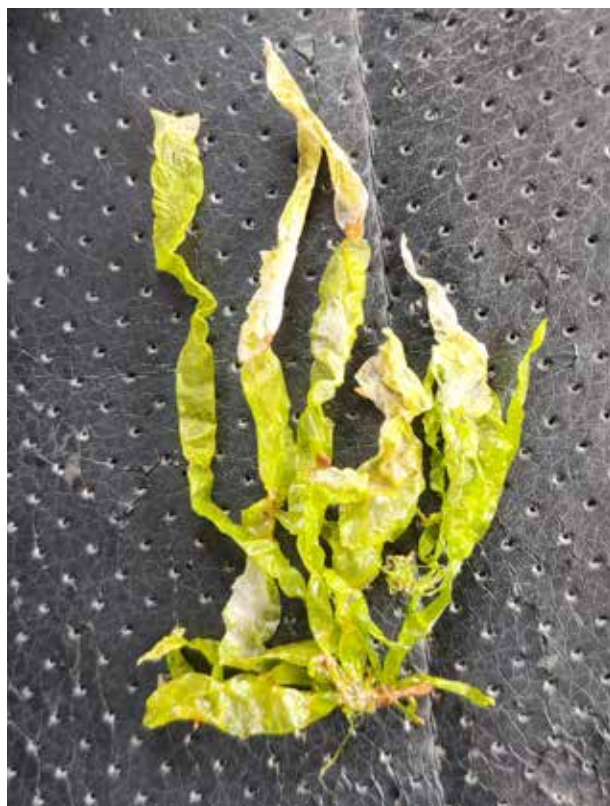
Рисунок 5. Внешний вид и выбро́сы морской водоросли ульвы Каспийского моря

Микробиологические исследования отобранных проб выбросов N. noltei свидетельствуют об их соответствии требованиям ТР ТС 021/2011. По результатам микробиологического анализа не обнаружено превышений ни по одному из нормируемых показате-