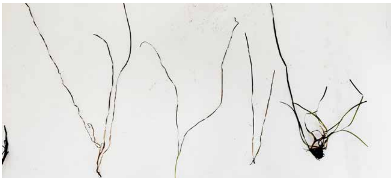
Рисунок 3. Образцы N. noltei Каспийского моря / Figure 3. Samples of N. noltei of the Caspian Sea

Визуально отличия двух видов трав N. noltei и S. pectinata очевидны (рис. 2). Однако, в процессе образования выбросов, в общую смесь попадают в основном листья указанных видов растений, которые визуально схожи. Идентификация других растений, входящих в состав выбросов вызывает затруднения.