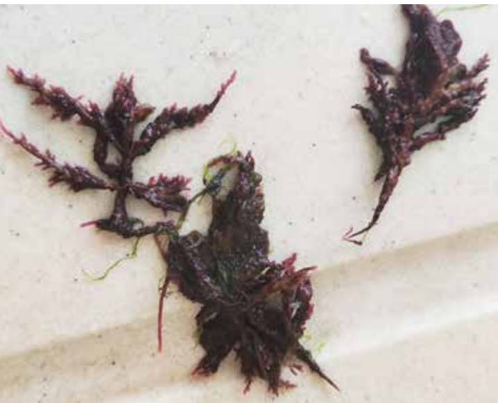
Рисунок 6. Внешний вид и заросли красной водоросли лорансии ( L. caspica ) Каспийского моря Figure 6. Appearance and thickets of the red algae loransia ( L. caspica ) of the Caspian Sea