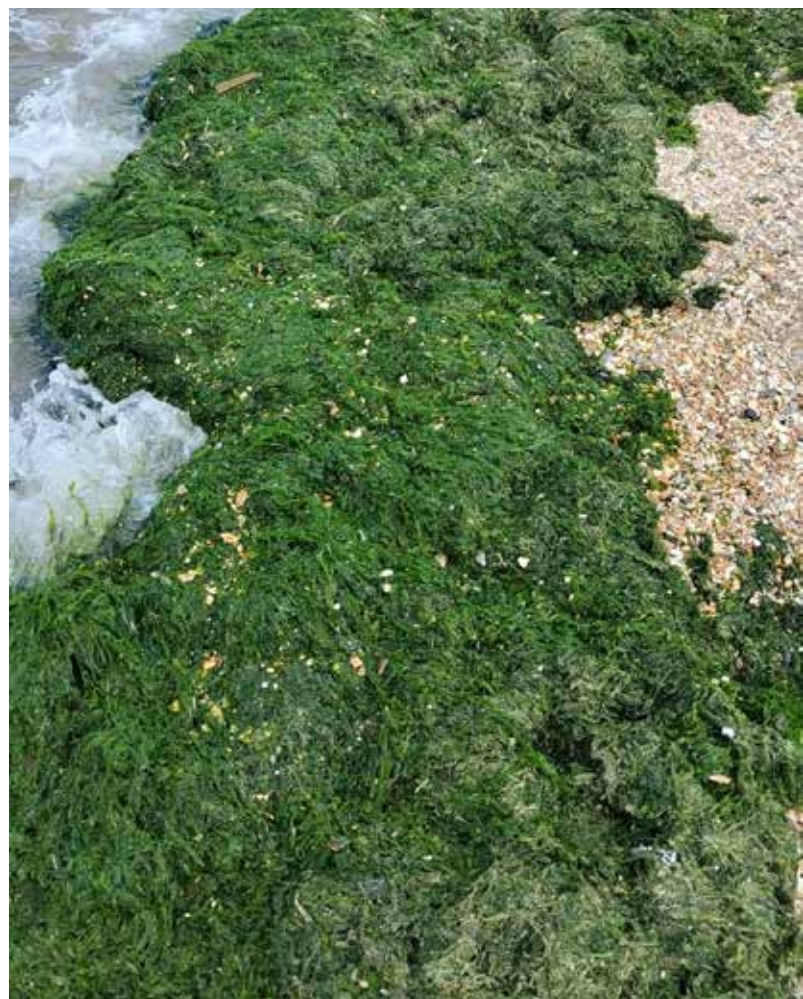
Figure 5. Appearance and emissions of marine algae from the Caspian Sea