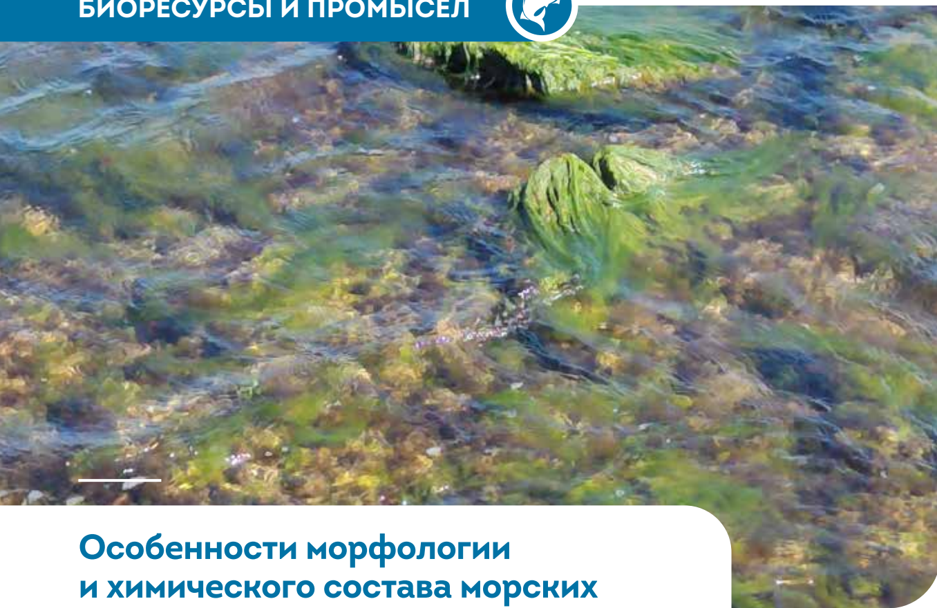
Сообщество растущей лорансии и зеленых нитчатых водорослей