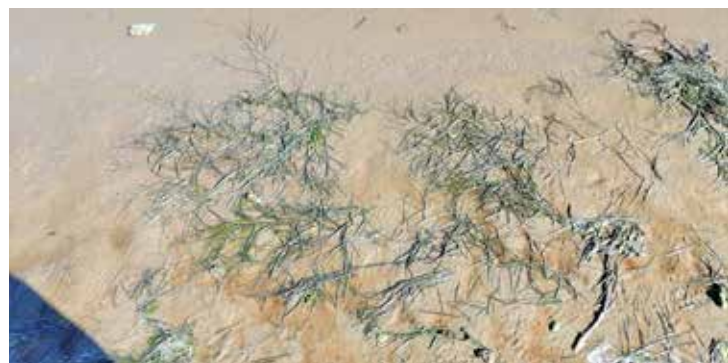
Рисунок 4. Заросли рдеста гребенчатого