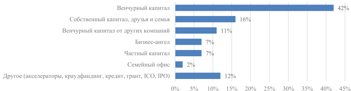
Рисунок 3. Источники финансирования стартапов в США